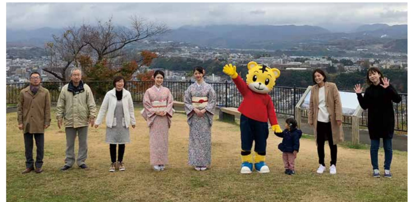
しまじろう

<公式サイト> https://kodomo.benesse.ne.jp/open/tv/