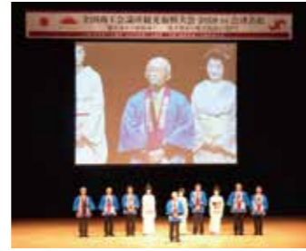
会津若松大会でのPRの様子

開催日：2020年2月13日(木)~15日(土) 会場：分科会 ホテル日航金沢 全体交流会 ANAクラウンプラザホテル金沢 全体会議 石川県立音楽堂コンサートホール 主催：日本商工会議所、金沢商工会議所 共催：石川県商工会議所連合会 内容：1日目 分科会、全体交流会 2日目 全体会議、エクスカージョン 3日目 エクスカージョン