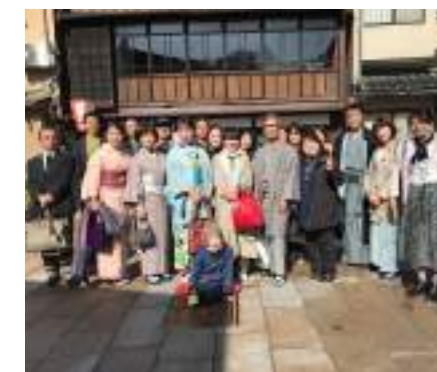
ボランティアエキストラのみなさん