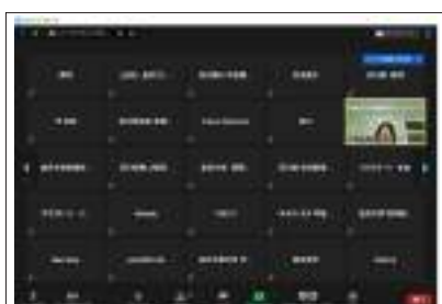
オンライン会議画面

当ビューローが主催する初めてのオンライン会議のため、何かとご不便をおかけしたこともありましたが、今回の経験を踏まえ、次の機会に向けて更に改善していきたいと思っております。