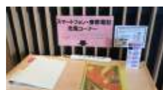
スマートフォン・携帯電話 充電コーナー