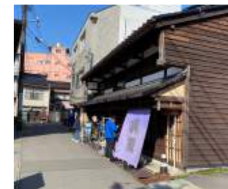
金澤町家情報館(老舗呉服屋の設定)