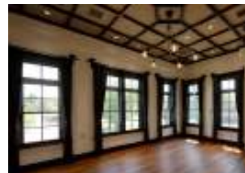
金沢偕行社 多目的室

住所: 石川県金沢市出羽町 3-2 開館時間: 9:30 ~ 17:30 (最終入館 17:00) 定休日: 月曜日 (祝日の場合は翌平日) 料金: 一般 500円、大学生 300円、高校生および18歳未満無料 (開館記念展1) 電話番号: 050-5541-8600 (ハローダイヤル) ※来館日時を予約する日時指定・定員制を導入 日時予約はこちら www.momat.go.jp/cg/