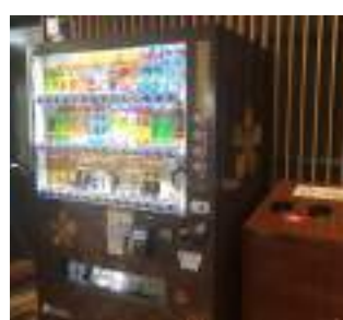
特別に装飾された自動販売機