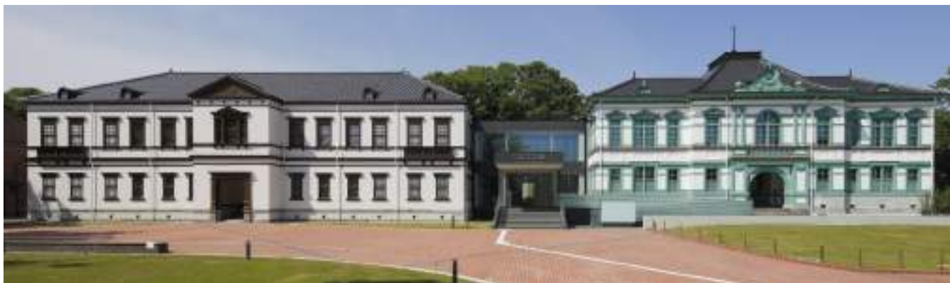
左: 第九師団司令部庁舎、右: 金沢偕行社

国立工芸館は、工芸を専門とする唯一の国立美術館であり、県立美術館といしかわ赤レンガミュージアムの間に位置しています。