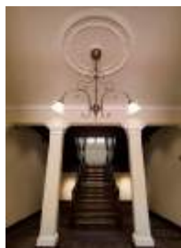
第九師団司令部庁舎 けやき造りの階段

いよいよ今年10月25日に開館を迎えます。名誉館長には、元サッカー日本代表の中田英寿氏が就任します。多くの皆様にお越しいただければ幸いです。