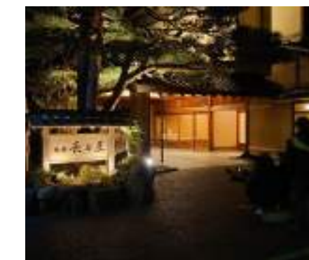
料亭旅館 金城樓(日本屈指の名旅館の設定)