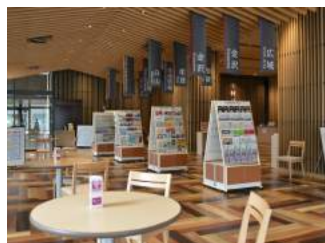
休憩スペース・観光情報コーナー 無料 Wi-Fi 完備。各種観光パンフレット

住 所：石川県金沢市南町4-1 金沢ニューグランドビル1F 営業時間：10:00～21:00(年中無休) アクセス：「南町・尾山神社」バス停から徒歩約3分 TEL：076-254-5020 FAX：076-254-5028 HP：https://www.hot-ishikawa.jp/spot/21458