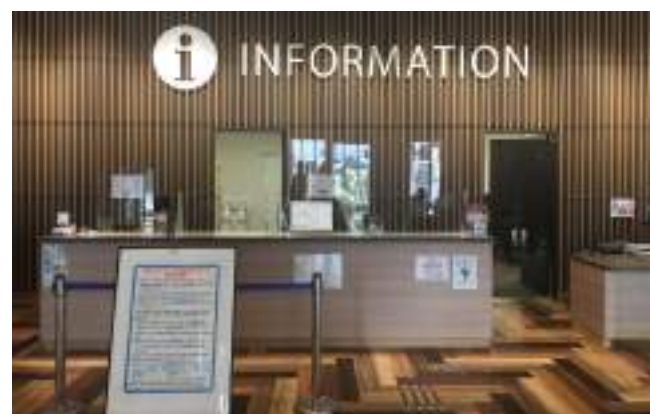
観光案内カウンター