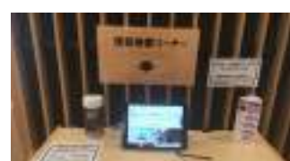
情報検索コーナー