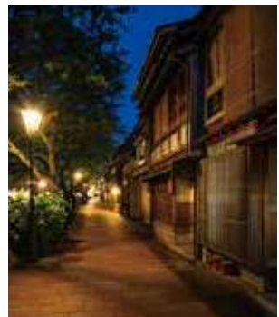
主計町茶屋街 映画「種まく旅人～華蓮のかがやき～」 主演・栗原千秋さんは「夜景がきれいで印象的」とコメント