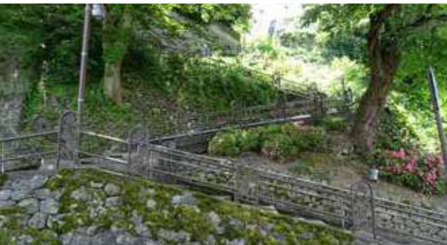
いしきりざか 石伐坂(W坂) 映画「いのちの停車場」 メガホンを取った成島監督が惚れ込んだスポット